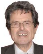
Alain MILON Président Sénateur de Vaucluse